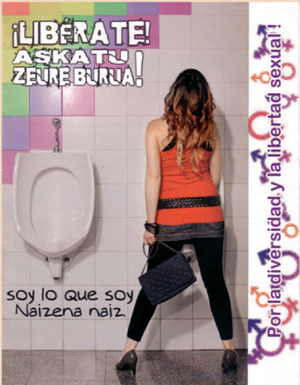
Cartel del Colectivo Por los Buenos Tratos con motivo del 28-J