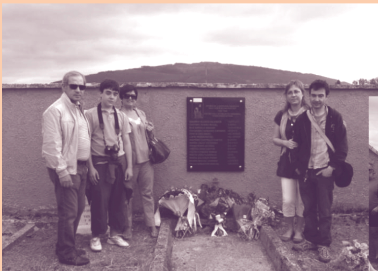
Distintas familias se hacen una sola en estos actos solidarios.

Sólo falta la realización de ese homenaje en el concejo de Berrioplano, cuya placa ya está colocada, y en el concejo de Oteiza, cuyos componentes no han tenido, hasta el momento, la sensibilidad de aprobar la colocación de dicha placa en su cementerio.