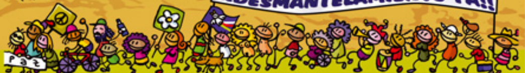
Cartel anunciador de la XXIII Marcha al Polígono de Tiro de las Bardenas