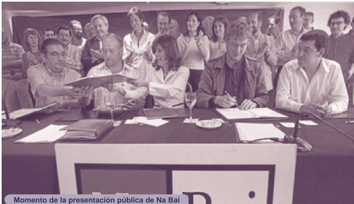
Momento de la presentación pública de Na Bai

Por otro lado, el reordenamiento del nacionalismo vasco pendiente de la decisión final de ETA, cosa que es muy clara en la CAV pero no tanto en Navarra. En la CAV se perfilan un polo en torno al PNV (con Hamaika Bat) y otro en torno a Batasuna con la integración de EA y con la más que dudosa inclusión de Aralar que quedaría en una posición muy difícil. Mientras que en Navarra se parte de una situación diferente: Batasuna se halla en una posición más débil que en la CAV ante ▶▶