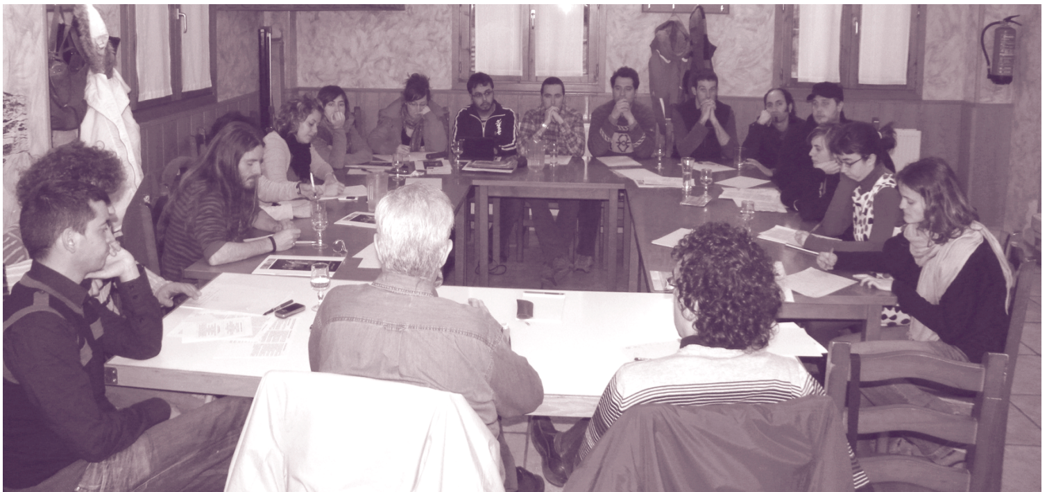
Algunos de los y las participantes en las jornadas en una de las sesiones

Con el cansancio reflejado en las caritas de los participantes, aún tuvimos fuerzas para hacer una visita a la granja escuela que nuestros amigos de Gure Sustraiak tienen habilitada. Conocimos las especiales