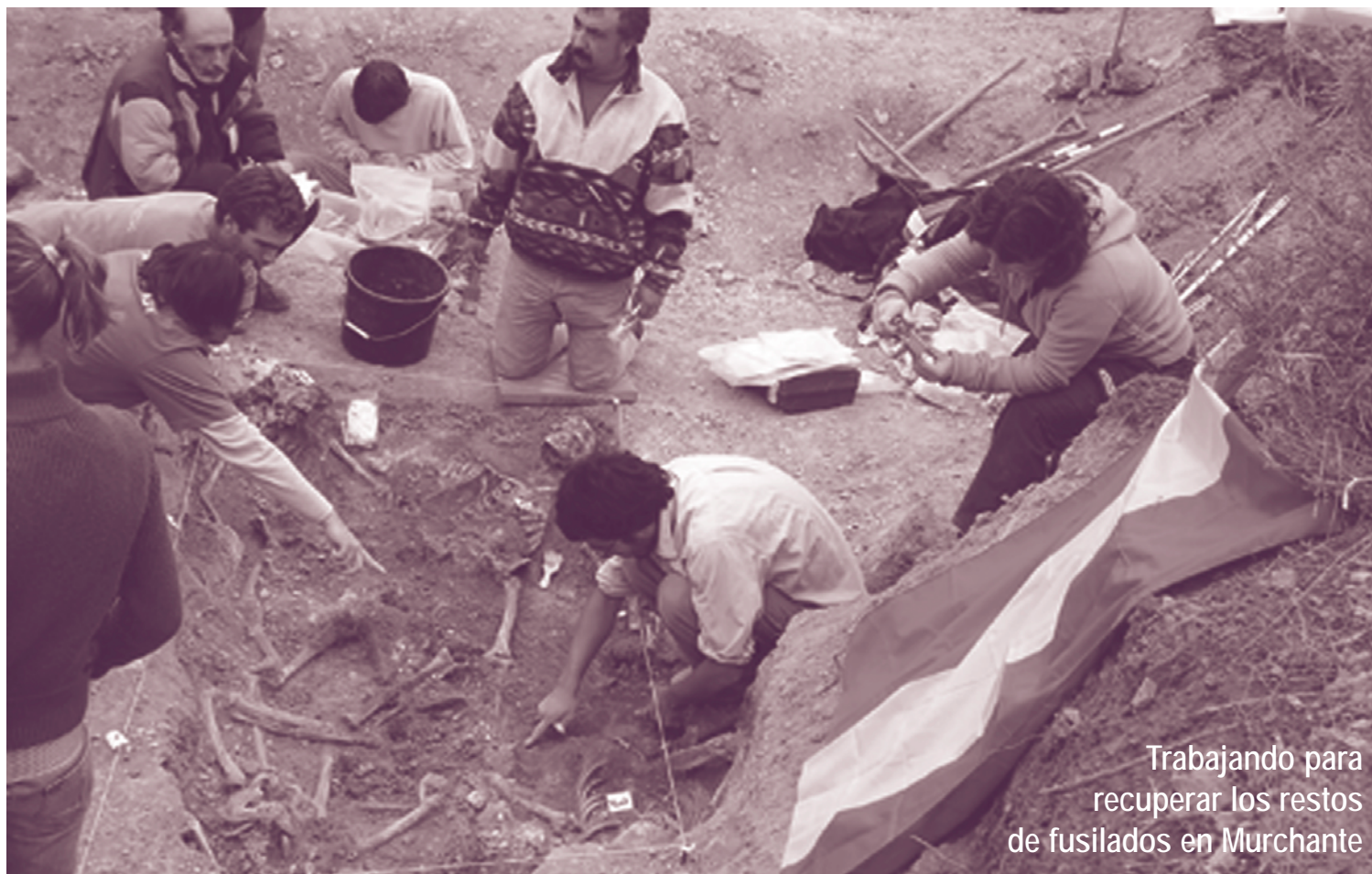
Trabajando para recuperar los restos de fusilados en Murchante

Actualmente buena parte de las instituciones apoyan la mayoría de las demandas de los familiares, los medios de comunicación ofrecen extensos reportajes al tema, y la respuesta de buena parte de la