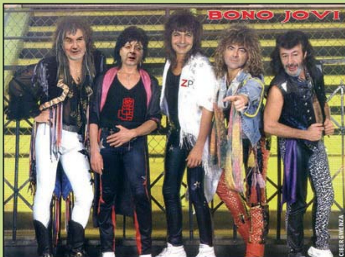
Imagen publicitaria de los dos grandes contrincantes del 9 M