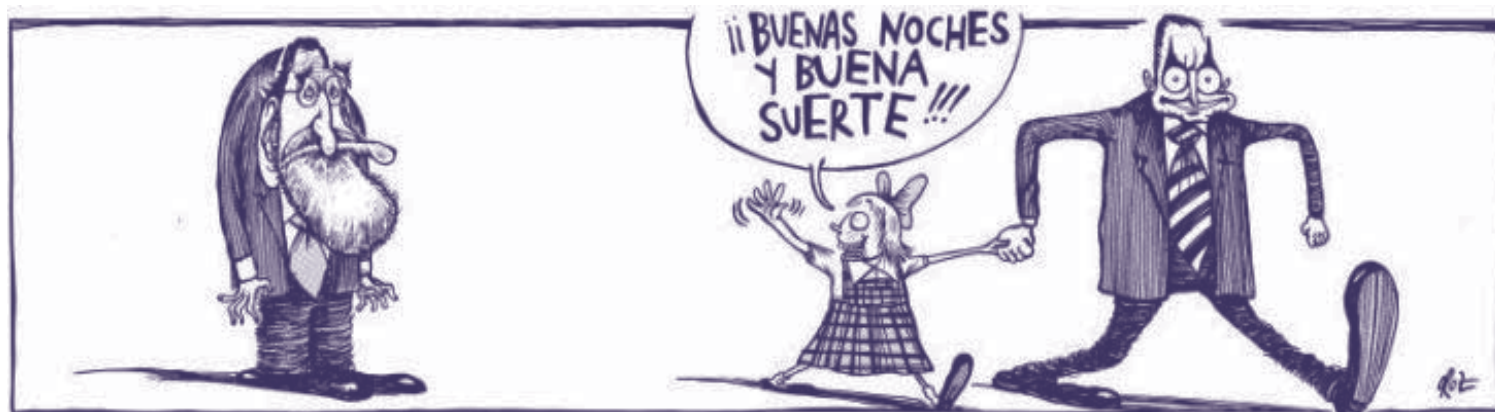
Oroz el 11 de Marzo en el Diario de Navarra

cienta para entender los problemas del PSN (sean los mencionados o los derivados de la huella de ETA o de su propia debilidad - en parte producida por la política de ZP hacia ETA con la cuestión navarra- o de la excepcionalidad y complejidad navarras). Na-Bai tropieza, asimismo, con dificultades de muy diverso tipo para realizar una política ajustada ante ETA y ANV/Batasuna. Las dos fuentes tradicionales del error anti-socialista tan asentadas en las bases de Na-Bai (el anti-españolismo abertzale y el anti-PSOE de la izquierda radical) le condicionan y son un freno para las corrientes renovadoras de Na-Bai. Máxime si se combina con una política su-