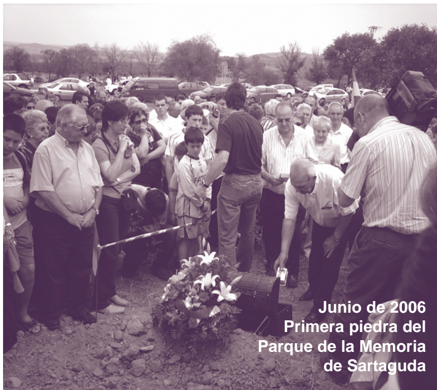
Junio de 2006 Primera piedra del Parque de la Memoria de Sartaguda

2 Dato utilizado en la Proposición no de Ley relativa a la anulación del Consejo de Guerra sumarísimo contra Lluís Companys apro-